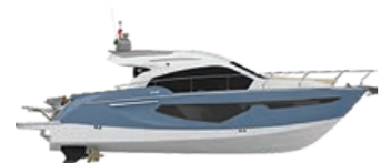
AIR BLUE METALLIZED (PAINT)