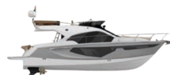
SILVER METALLIZED (PAINT)