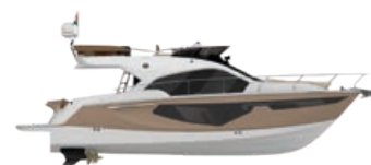
GOLD METALLIZED (PAINT)