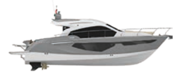
SILVER METALLIZED (PAINT)