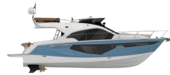
AIR BLUE METALLIZED (PAINT)