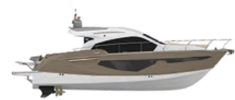
GOLD METALLIZED (PAINT)